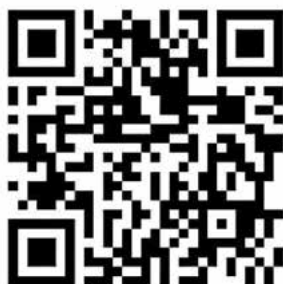
JAM VG BAUNACH AUF INSTAGRAM