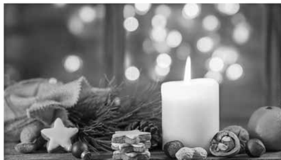
Vorweihnachtliche Feier bei Kaffee und Kuchen.

am Dienstag, 17.12.2024 um 14.00 Uhr in den Marktsaal in Rentweinsdorf ein