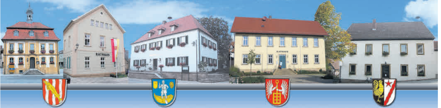
Stadt Baunach Gemeinde Reckendorf Gemeinde Lauter Gemeinde Gerach

Amtliches Bekanntmachungsorgan für die Verwaltungsgemeinschaft Baunach und die Mitgliedsgemeinden