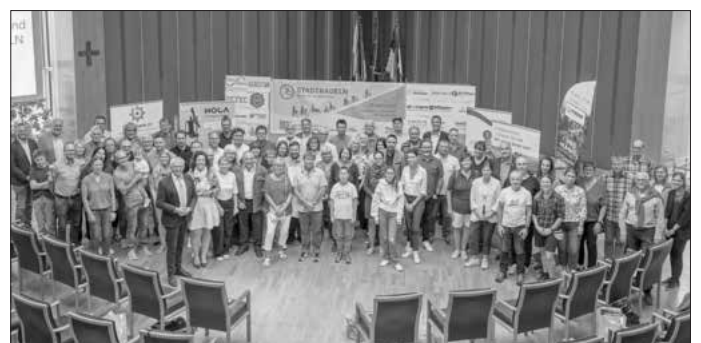
Gruppenbild mit allen Preisträgerinnen und Preisträgern beim diesjährigen STADTRADELN