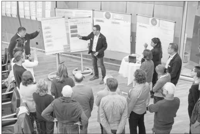
Etwa 50 Beteiligte tauschten sich im großen Sitzungssaal des Landratsamtes zu wichtigen Aspekten der Nachhaltigkeit aus.

Die Beteiligten sind sich einig: Die Zeit zu handeln ist jetzt. Denn nur durch gemeinsames Engagement und innovative Ansätze kann der Landkreis Bamberg zu einem Vorreiter in Sachen Nachhaltigkeit werden.