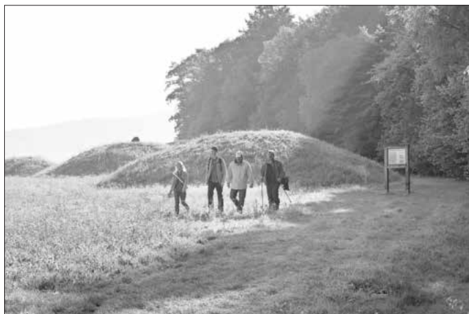
Wandern im Bamberger Land

Weitere Informationen: www.bambergerland.de/wandern .