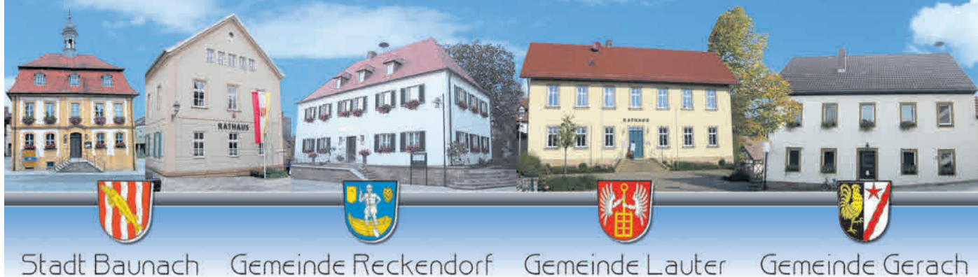
Stadt Baunach Gemeinde Reckendorf Gemeinde Lauter Gemeinde Gerach

Amtliches Bekanntmachungsorgan für die Verwaltungsgemeinschaft Baunach und die Mitgliedsgemeinden