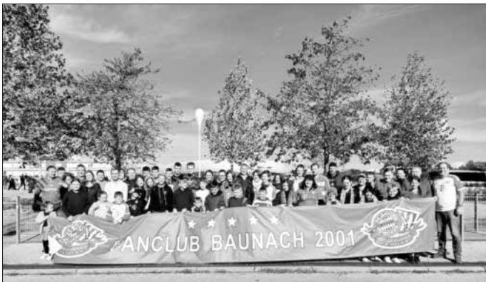
Die Reisegruppe vor der Allianz-Arena

Der FC Bayern Fanclub Baunach 2001 bedankt sich bei allen Kindern, Mitfahrern und der Feuerwehr Baunach, Priegendorf, Reckenneusig, Dorgendorf und Daschendorf für das gute Gelingen der Fahrt.