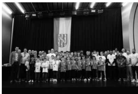
Wir gratulieren an dieser Stelle noch einmal ganz herzlich zu den Auszeichnungen

Die U 15/1 der Fußballabteilung , sie wurden Meister in der Kreisliga BA/BT West