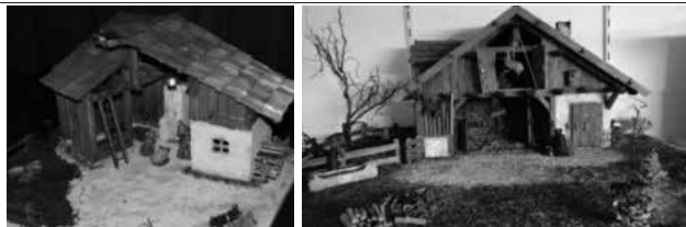
Bilder: Ulrich Schmitt gebaut von Ulrich Schmitt