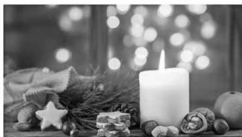
Vorweihnachtliche Feier bei Kaffee und Kuchen.

am Dienstag, 12.12.2023 um 14.00 Uhr in den Marktsaal in Rentweinsdorf ein