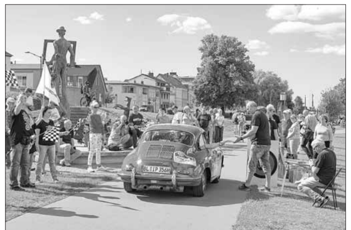
Historischer Porsche 356 A (1957)

Rallye-Legende und Namenspatron Walter Röhrl hat seine Teilnahme bereits zugesagt. Röhrl ist Namensgeber, Schirmherr und geht bei der 2. Röhrl-Klassik an den Start. Außer Walter Röhrl (Startnummer 1) hat die Röhrl-Klassik einen weiteren prominenten Teilnehmer: Schauspieler Hinnerk Schönemann (Startnummer 8) – bekannt aus zahlreichen Fernsehfilmen und -serien – wird einen historischen Porsche pilotieren.