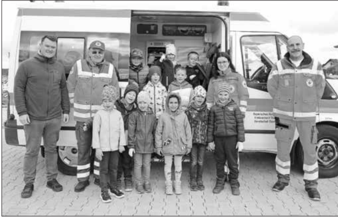
gez. Günther Erster Bürgermeister