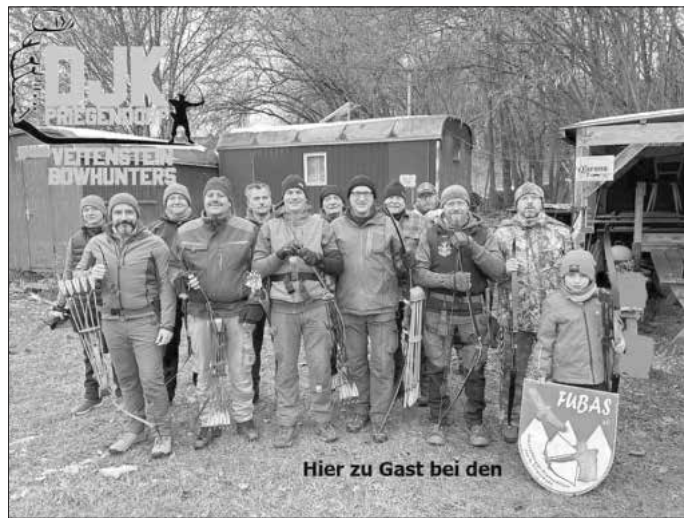
Hier zu Gast bei den FuBas in Priesendorf.

Hier wurden 3 Turniere in drei Monaten ausgetragen und bei wahnsinnig schönen Naturerlebnissen auch super gute Ergebnisse.