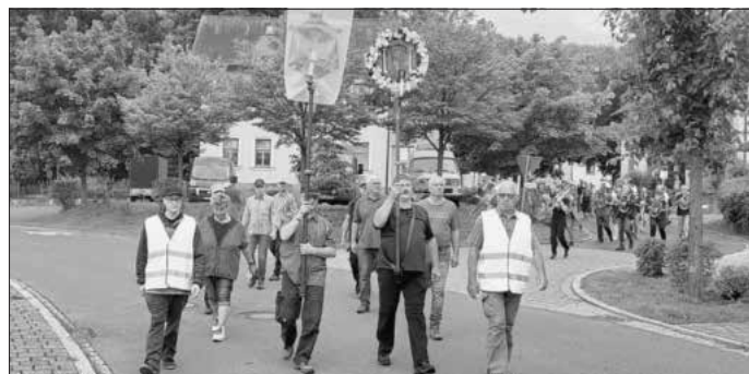
Wallfahrt 2021 in Daschendorf

Liebe Wallfahrer aus Baunach und Daschendorf wir freuen uns, dass wir nach dem derzeitigen Stand der Dinge heuer wieder unbehindert nach Vierzehnheiligen wallfahren können. Letztes Jahr sind wir mit (nur) 65 Personen nur hinauf gelaufen und haben auf den Rückmarsch am Sonntag verzichtet.