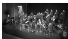
Big Band „Triple B“

Die Big Band TRIPLE B des Musikvereins Stadtkapelle Baunach e.V. präsentiert ein breites Spektrum an grooviger Musik. In ihrer Big-Band-Besetzung, die